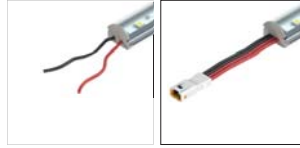
01: Kablolu (yandan çıkışlı)