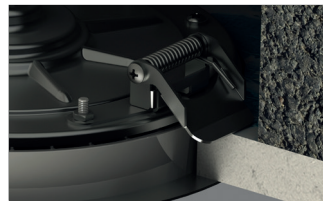
Yaylı montaj örnek görseli