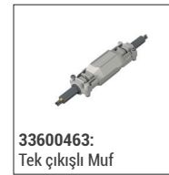
33600463: Tek çıkışlı Muf