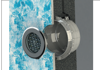
34600946: Montaj Kutusu