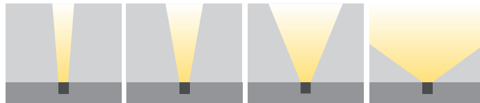
N: Ekstra Dar Açılı